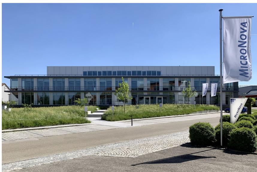
Der Hauptsitz der MicroNova AG befindet sich im oberbayerischen Vierkirchen. Die Vision der Gruppe lautet „Latest Technology Creating Success“.

Die genannten Projekte werden über die gesamte Unternehmensgruppe – bestehend aus der MicroNova AG, der ks.MicroNova GmbH und der cz.MicroNova s.r.o. – an bis zu neun Standorten durchgeführt