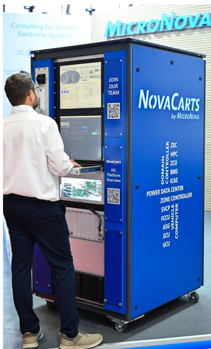
Die HiL-Produktfamilie von MicroNova zeichnet sich durch maximale Modularität und Skalierbarkeit sowie vielfältige Vernetzungsmöglichkeiten aus.

Wir benötigen eine Projektmanagement-Software, mit der wir die hohe Komplexität unserer Projekte einfach abbilden können. Der Mix aus verteilten, teils internationalen Strukturen und hochgradig heterogenen Anwendungsfällen sowie höchst individuellen Kundenanforderungen ist durchaus anspruchsvoll. Mit Projektron BCS erfüllt unser Team diese Aufgabe Tag für Tag aufs Neue sehr erfolgreich. Qualität, Kosten und Termintreue entsprechen unseren Erwartungen und denen unserer Kunden.