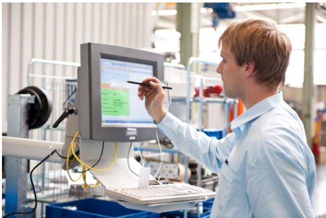
SALT Solutions Implementierung bei der Firma Cloos Schweiß-technik

Standorten in Dresden, Düsseldorf, München und Würzburg sind über 300 Mitarbeiter beschäftigt.